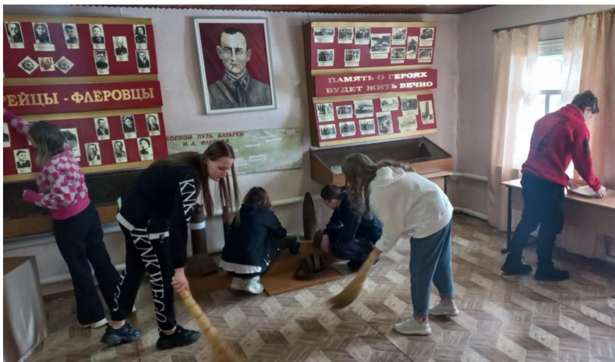
Уборка внутренних помещений Дома-музея И.А.Флёрова