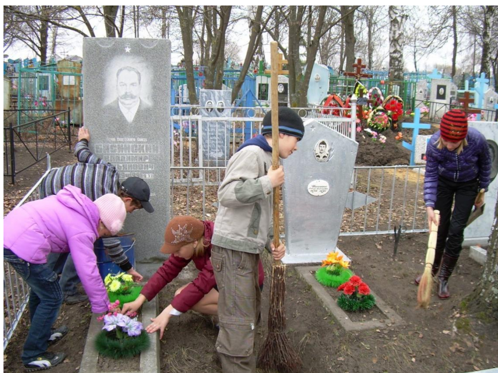
Уход за могилой Героя Советского Союза Басинского В.Л.