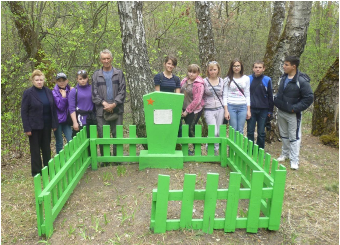
Воинское захоронение умерших от ран в госпиталях воинов Красной Армии