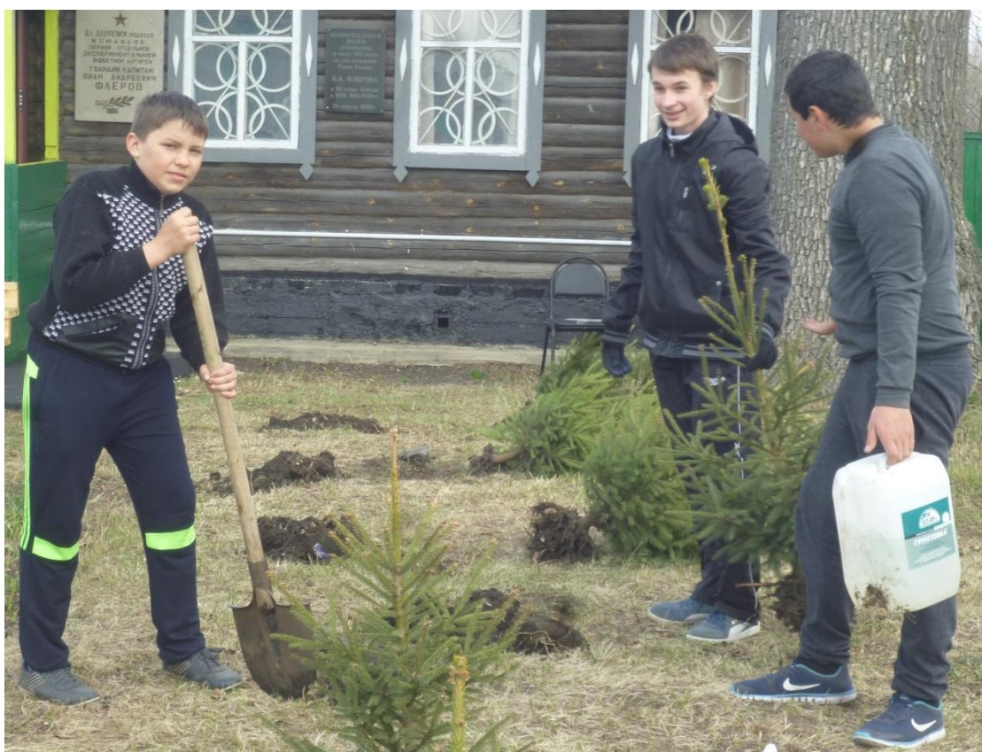
Посадка саженцев елей на территории Дома-музея И.А.Флёрова