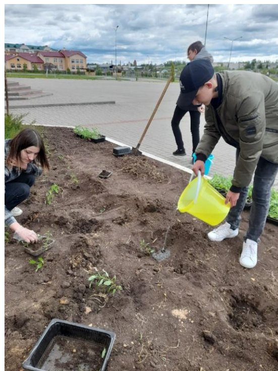
Посади цветок – укрась планету!