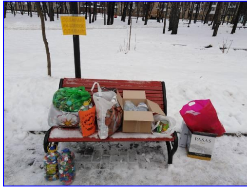
Фото 5. Экоакция «Собирай! Разделяй! Сдавай!»