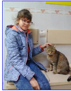
Фото 4. В приюте для животных «Доброе сердце»