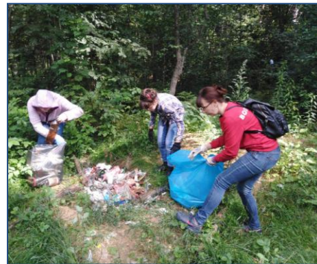
Фото 7. Август-сентябрь 2020г. Районная акция «Чистый лес»