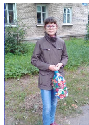
Фото 3. Сдача вторсырья и пластиковых крышек в пункты приема