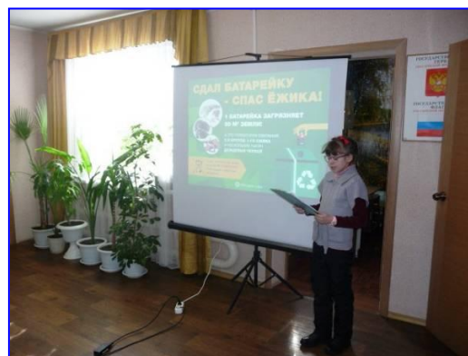
Фото 1. Агитбеседы на станции юннатов