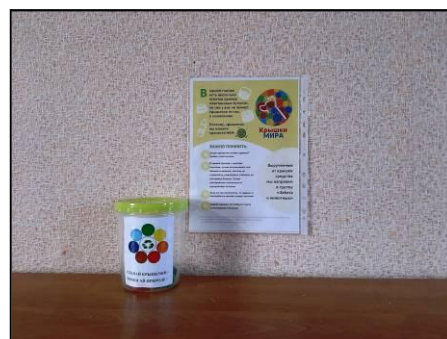
Фото 2. Контейнеры для сбора пластиковых крышечек и использованных батареек