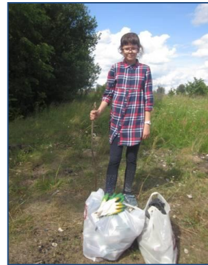
Фото 6. Уборка лесных и береговых зон